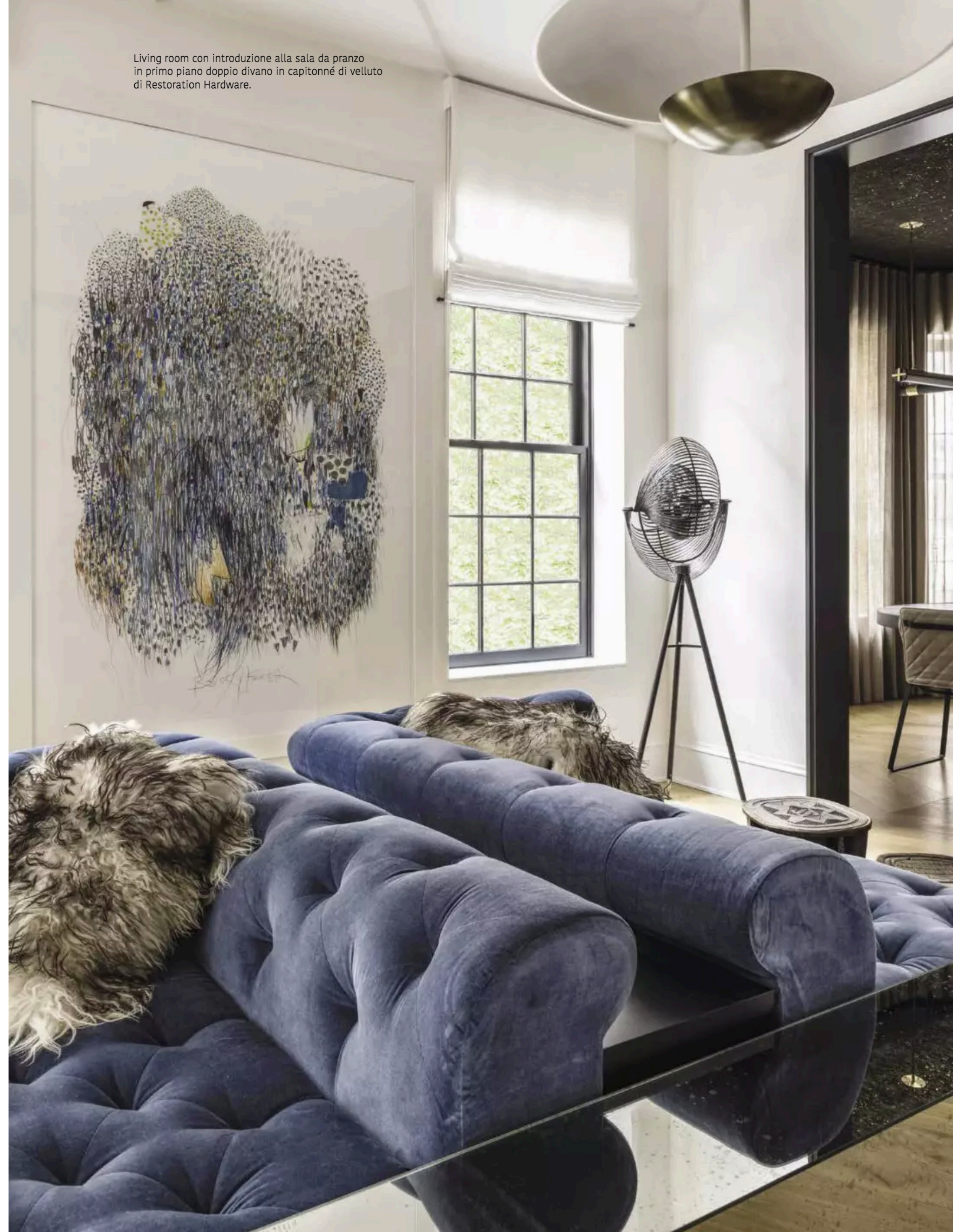
Living room con introduzione alla sala da pranzo in primo piano doppio divano in capitonné di velluto di Restoration Hardware.