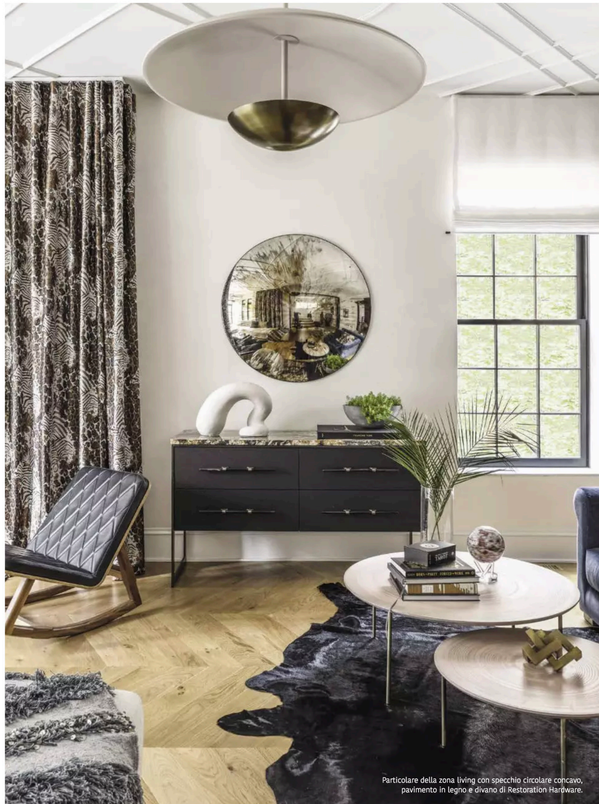
Particolare della zona living con specchio circolare concavo, pavimento in legno e divano di Restoration Hardware.