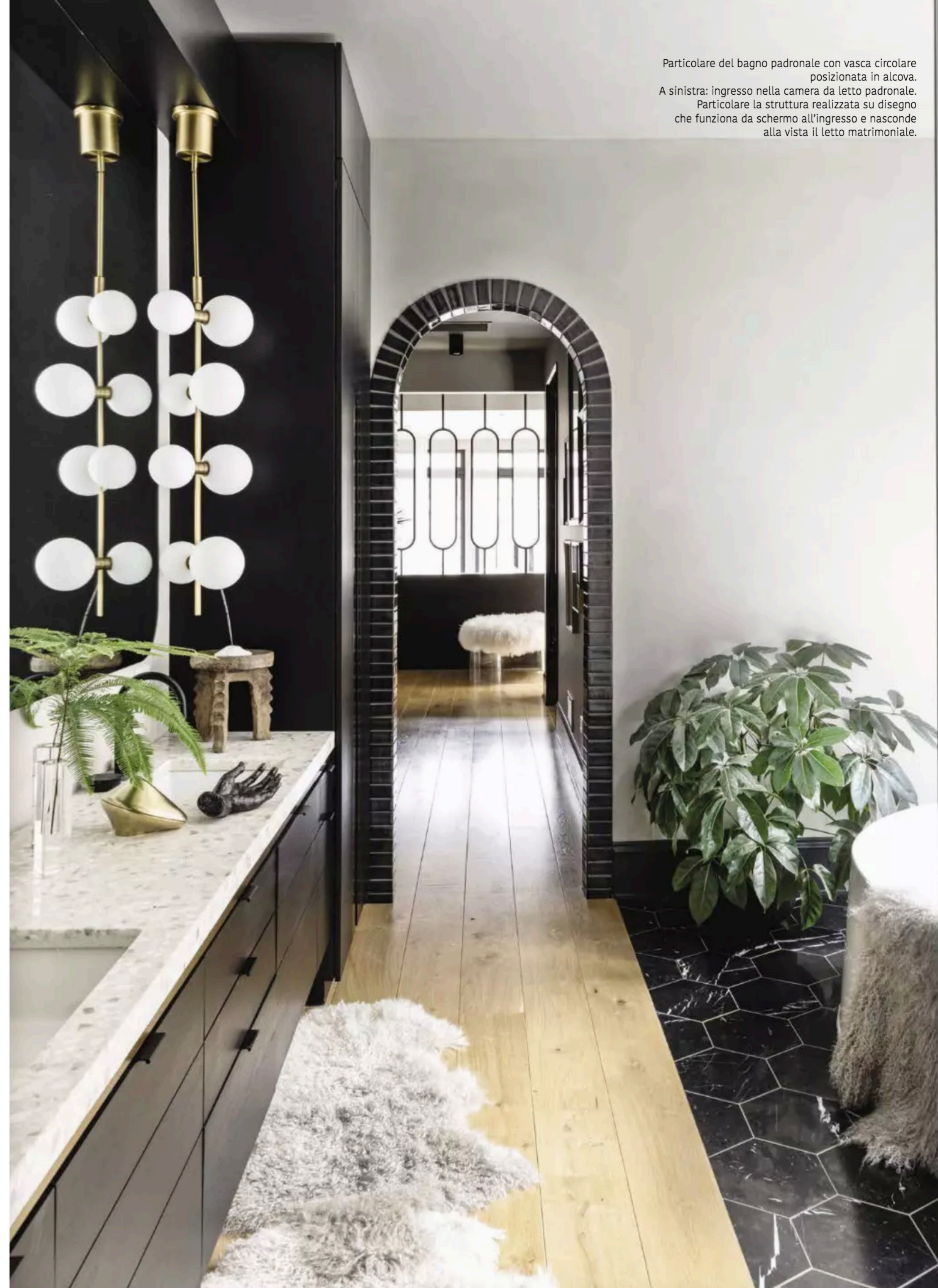
Particolare del bagno padronale con vasca circolare posizionata in alcova. A sinistra: ingresso nella camera da letto padronale. Particolare la struttura realizzata su disegno che funziona da schermo all'ingresso e nasconde alla vista il letto matrimoniale.