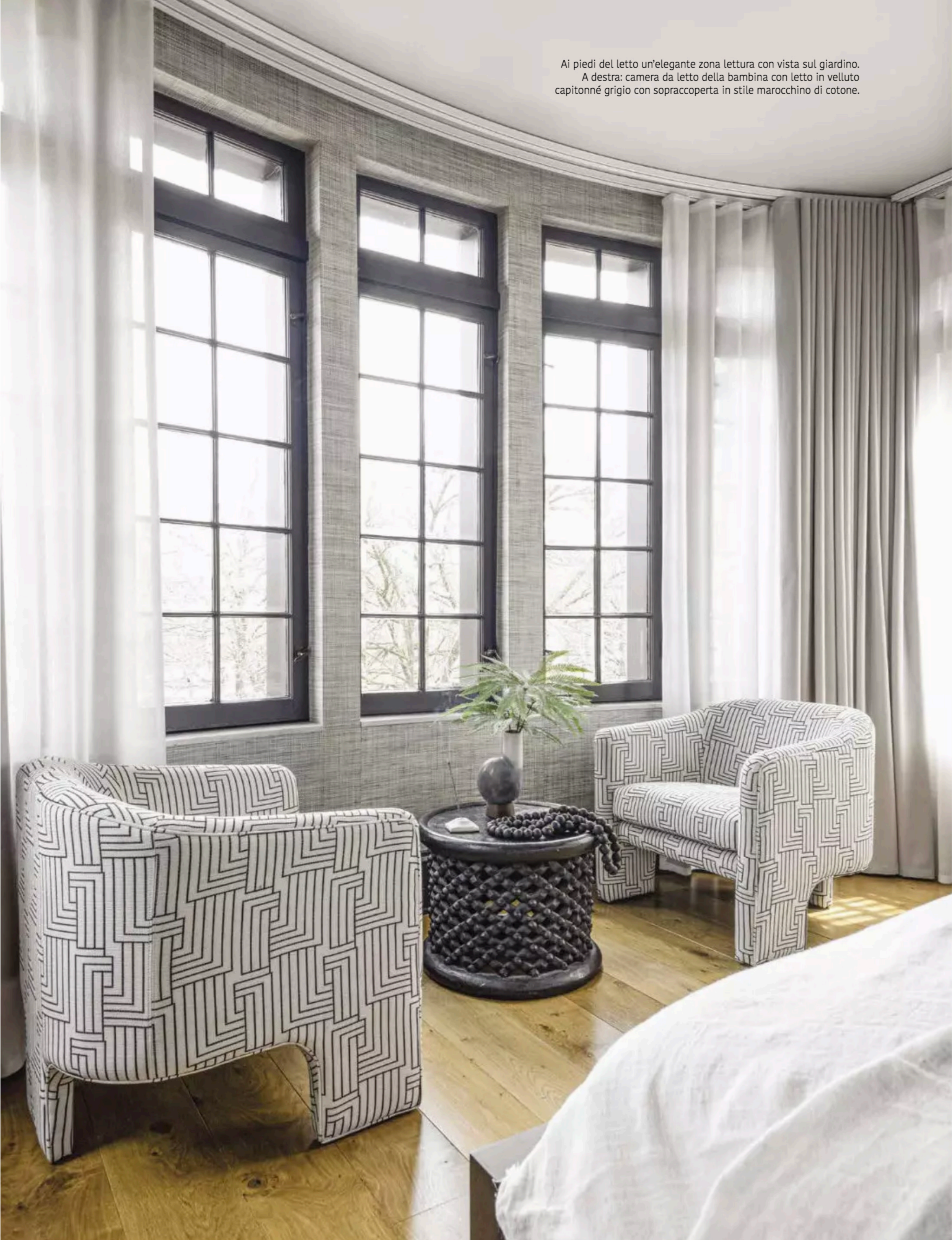
Ai piedi del letto un'elegante zona lettura con vista sul giardino. A destra: camera da letto della bambina con letto in velluto capitonné grigio con sopracoperta in stile marocchino di cotone.