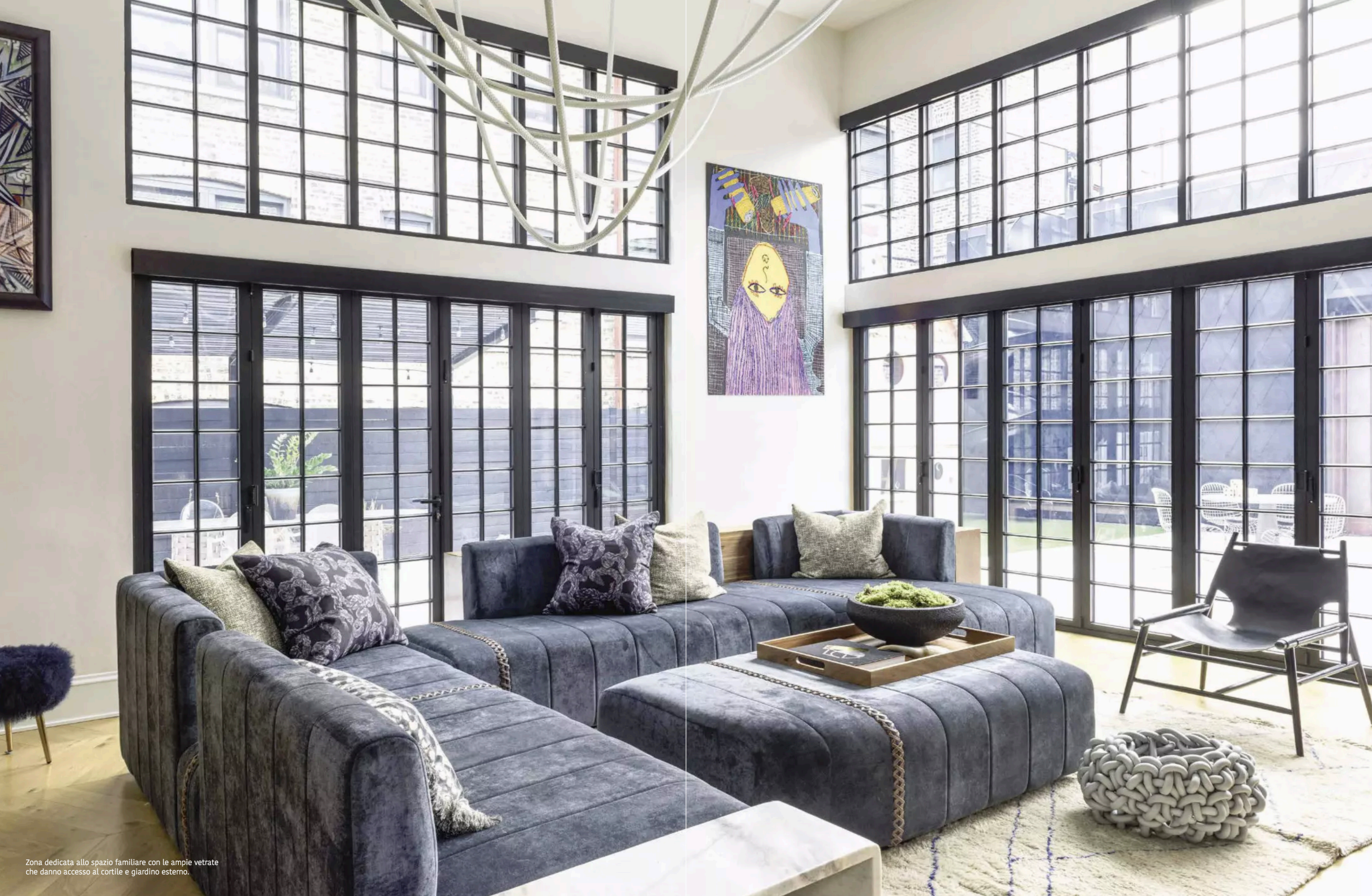
Zona dedicata allo spazio familiare con le ampie vetrate che danno accesso al cortile e giardino esterno.